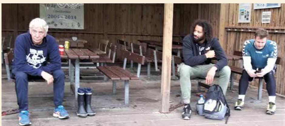
3 trætte disc golfspillere efter klubmesterskabet