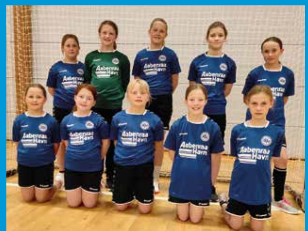
BVU's u11 piger har fået sponsoreret nye spillertrojer fra Åbenrå havn.